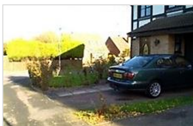
HDR なし (露出過度)

NGENUITY は、HDR (High Dynamic Range) ビデオカメラを搭載した世界初の眼科用リアルタイム映像システムで、硝子体手術において待望されていた可視化を3次元映像として実現します。3D ビデオHDRカメラで撮影した映像をハイスピードで最適化し、デジタル高解像度3D 4Kモニターと専用の偏光メガネによって、繊細な眼底組織をこれまでになく鮮明で奥行きのある表現が可能となりました。