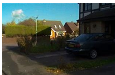
HDR なし (露出不足)