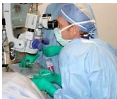
光学顕微鏡を使用した手術

さらに、NGENUITYのワイドスクリーン・ディスプレイにより、医師は長時間にわたって不自然な姿勢で顕微鏡を覗きこむことから解放され、自由に身体を動かすことができ、頸椎への負担を軽減することができるようになります 1 。そして医師だけでなく、手術室にいる誰もが同じ手術映像をリアルタイムで観察することができるようになり、オペ室でのコミュニケーションを向上させ、同時に優れた教育環境を提供します。