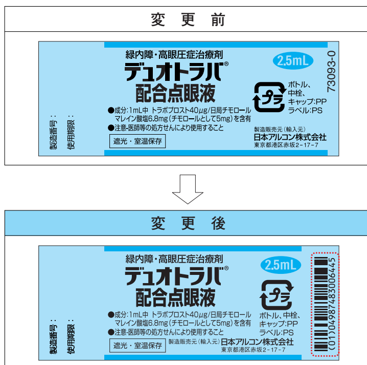
図 点眼ボトルラベル (例: デュオトラバ®配合点眼液)

厚生労働省通知「医療用医薬品へのバーコード表示の実施について」(平成18年9月15日付薬食安発第0915001号)に基づき、医療用医薬品の取り違えによる医療事故防止及びトレーサビリティの確保を推進するため、調剤包装単位であるボトルのラベルにGS1-RSSバーコードを新規付与しました。これに伴い、ラベルの印刷レイアウトを以下のように変更いたします。